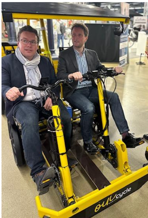
Clément Beaune ministre des Transports