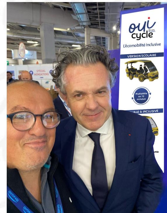
Christophe Béchu Ministre de l'Ecologie